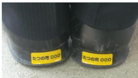
ピカッとシューズステッカー 見本

高齢者などのご家族などが、万が一所在不明になった場合の捜索をスムーズに行うために、高齢者等の名前や特徴、写真など本人の情報をあらかじめ登録しておく制度です。