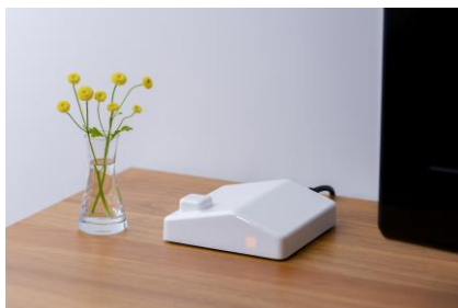
【まごチャンネル with SECOM】