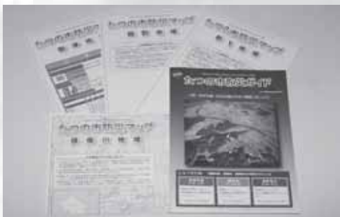
防災マップ（たつの市防災ガイド）