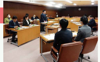
▲江東区での視察の様子