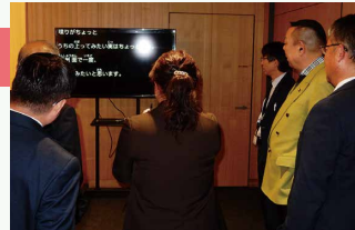
▲川崎市での現地視察の様子