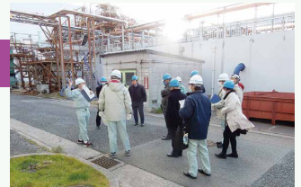
▲兵庫西スラッジセンターでの現地視察の様子