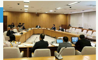
▲兵庫県庁での視察の様子