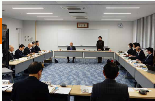
▲加東市での視察の様子