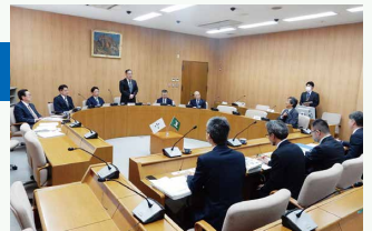
▲笠岡市での視察の様子