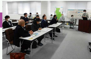
▲兵庫県揖保川浄化センターでの視察の様子