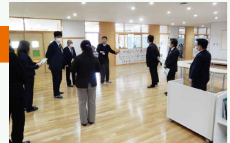
▲加東市での現地視察の様子