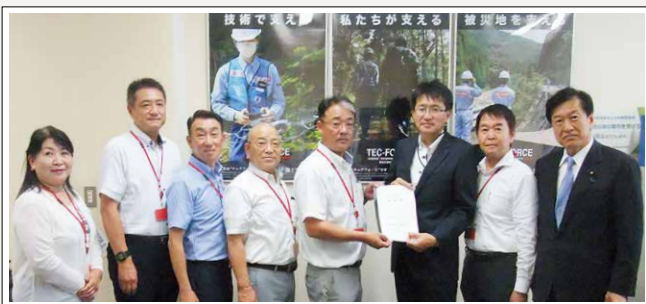
▲国土交通省にて陳情書を手交