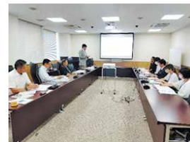
▲四万十市での視察の様子