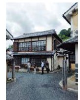
▲内子町での現地視察の様子

8月24日(木)開催の全員協議会において視察結果の報告があり、主に四万十市における視察内容について、6月定例会でオーガニック給食についての一般質問があったことから、報告を受けた議員から次のような質問がありました。