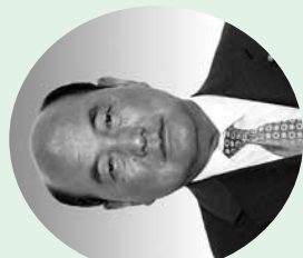
井上 仁 議長