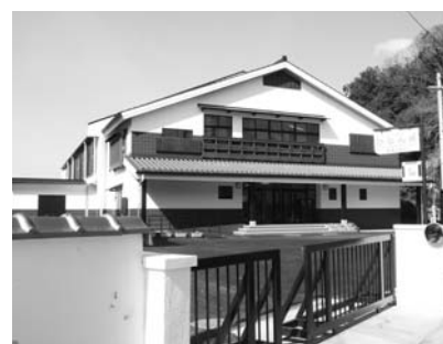
室津小学校完成写真