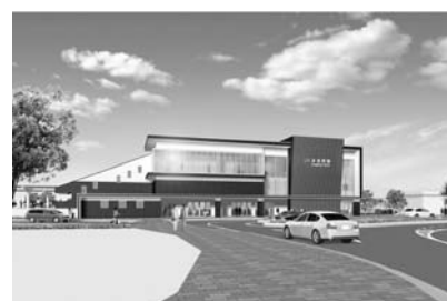
本龍野駅完成バース