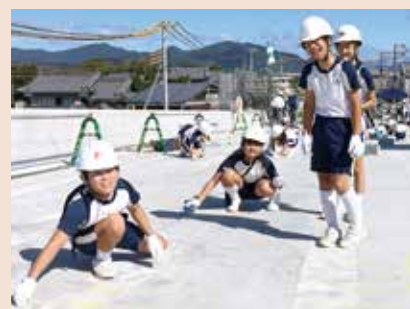
9月17日現場見学会の様子