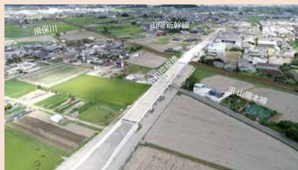
上空より南から北を見て