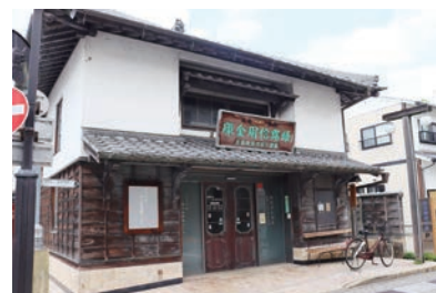
たつの市空き家相談センター