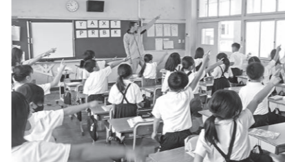
小学校外国語活動

「How are you?」「I'm fine.」「How is the weather today?」「It's sunny.」 小学校の教室から子どもたちの元気な声が響いてきます。 たつ市では、外国語指導助手(ALT)を小学校3・4年生の外国語活動および5・6年生の外国語(英語)の授業において、各学級週1時間ずつ配置し、発達段階に応じて英語によるコミュニケーション能力の育成を図っています。子どもたちは、ALTの口の動きをまねたり、繰り返し表現したりするなど、英語表現を楽しんでいます。授業中だけでなく、休み時間や給食の時間、学校行事等でも自ら積極的にALTに話しかける姿も見られます。 夏休みには、英語の体験活動として、小学校1～4年生を対象にした「わくわく英語教室」と5・6年生を対象にした「イングリッシュ チャレンジ」を開催する予定です。ALTによる絵本の読み聞かせや英語ゲームなど、子どもたちは、元気いっぱい英語活動を楽しむことができます。 また、中学校の外国語(英語)の授業においても、各学級週1時間ずつALTを配置しています。英語教諭とALTとが連携し、授業中、日本語を使わずに英語を使って学習する場面を増やしています。教室全体が英語で話そうとする雰囲気になり、子どもたちは、よりネイティブな表現をめざして学習しています。 今後も、小学校段階から中学校までALTとの活動を取り入れて英語に親しむ機会を設けるなど、たつ市の子供たちが、楽しみながら英語によるコミュニケーション能力を向上できるよう、活動に取り組んでいきます。