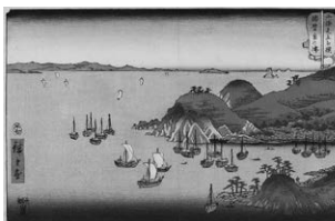
山海見立相撲 播磨室の津