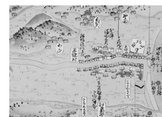
中国行程記 巻四(正條宿部分) 明和元(1764)年 萩博物館蔵