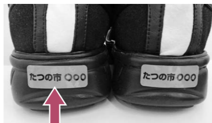
ピカッとシューズステッカー