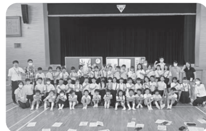
揖西西小学校4年生1、2組