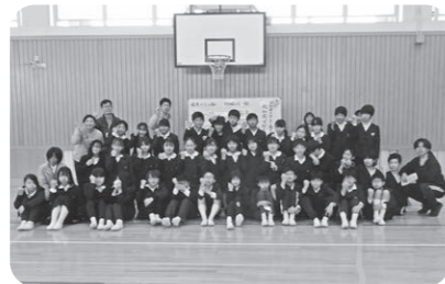
小宅小学校6年生2組(現中学1年生)