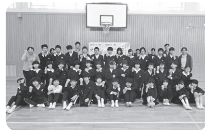
小宅小学校6年生1組(現中学1年生)