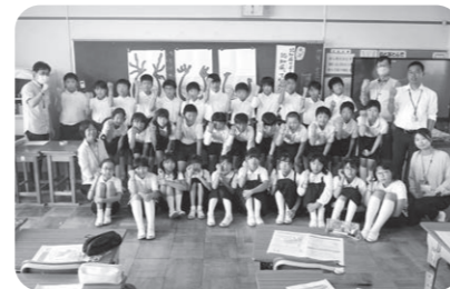
揖西東小学校5年生