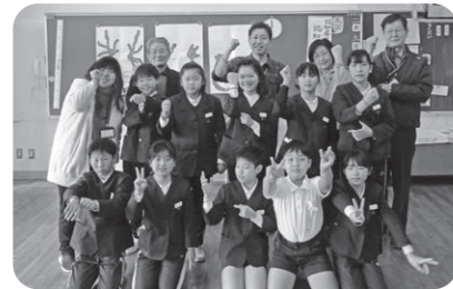
河内小学校4年生(現5年生)