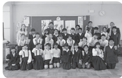
誉田小学校4年生(現5年生)