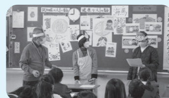
キャラバン・メイトによる寸劇場面

認知症になっても安心して暮らせるまちづくりにボランティアで協力してくださっています。