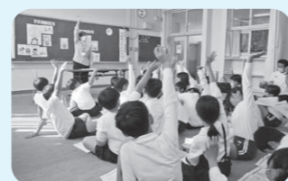
キャラバン・メイトによる講座