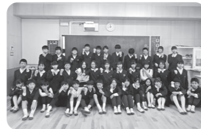
小宅小学校6年生3組(現中学1年生)