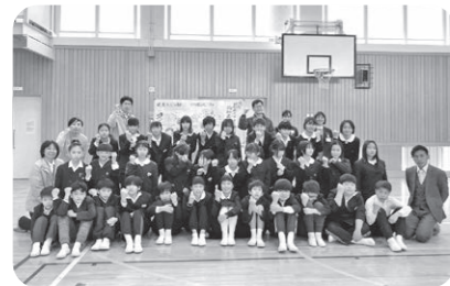
小宅小学校6年生4組(現中学1年生)