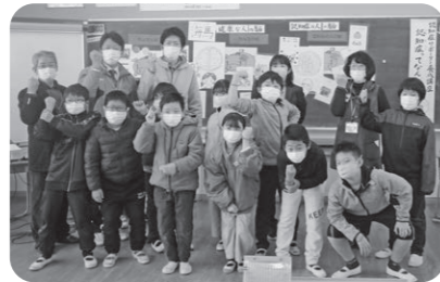
播磨高原東小学校4年生(現5年生)