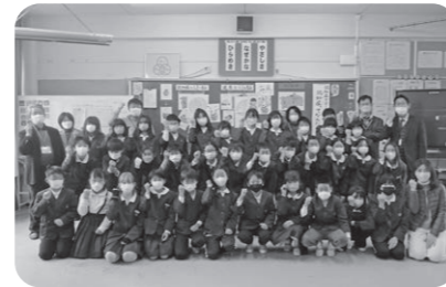
新宮小学校4年生(現5年生)