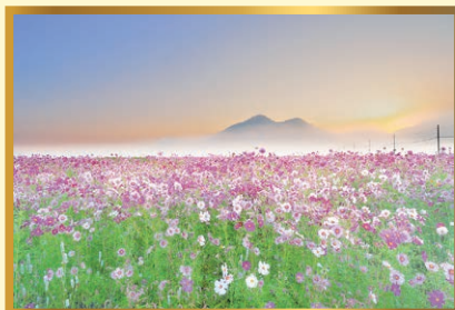
「霧の花園」 (撮影地：揖保川町)