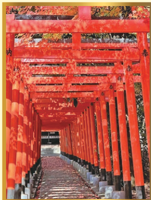
「秋色の稲荷参道」 (撮影地：神岡町) 田中 一典さん