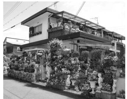
第4回市長賞受賞花壇

◎応募期間 4月1日(木)～4月9日(金) ◎応募方法 応募用紙に、平成22年春に撮影した花壇の写真1枚を付けて提出してください。 ◎審査方法 道路からの現地審査(4月下旬) ※応募写真は審査の対象にはなりません。 ◎提出・問い合わせ先 町並み対策課(☎64-3167)、新地域整備課(☎75-2430)、旧地域整備課(☎72-7603)、御地域整備課(☎322-2243)