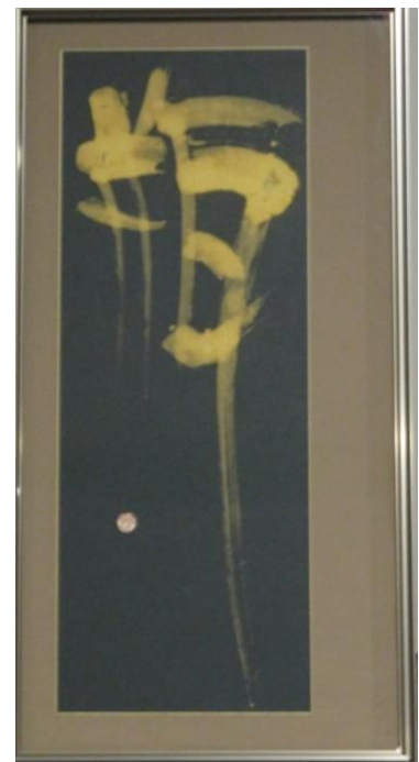
書のアート作品例「瓶」