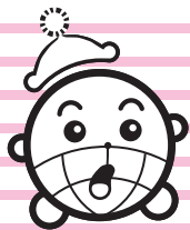
国保キャラクター「コッケン」