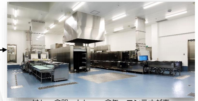
はし、食器、トレー、食缶、コンテナが専用の洗浄機で効率的、衛生的に洗浄されま