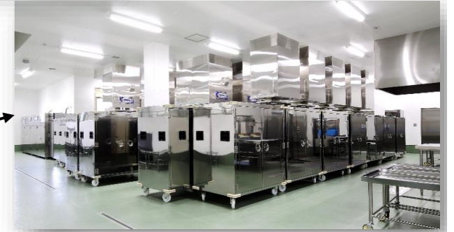
洗い上がった、食器、食缶は、専用の消毒保管装置で熱風消毒されコンテナ室で保管