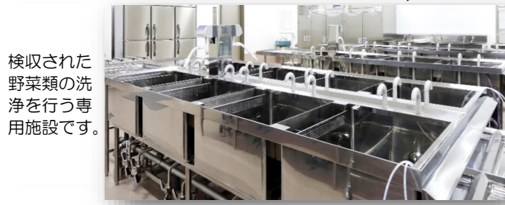
検収された野菜類の洗浄を行う専用施設です。