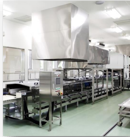
ご飯を炊く連続炊飯機です。炊飯釜専用の洗浄機もあります。