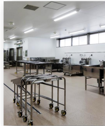
給食調理に使う食材を仕入れ、検品する部屋です。