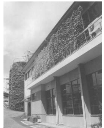
特別賞【団体の部】受賞作品 ヒガシマル醤油株式会社 様