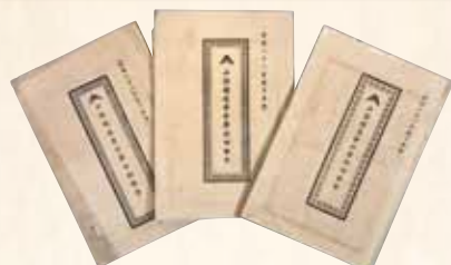
山陽鉄道会社営業報告書 明治21~23年 個人蔵