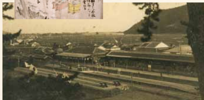
明治39年の竜野駅を北から望む