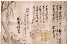
岡専鮎鮎お品書き 館蔵

「乗り鉄」「撮り鉄」「模型鉄」など多くの愛好者を魅了する鉄道ですが、一人でも多くの方が、鉄道の歴史を楽しむ「歴鉄」となるとたつのの歴史に興味をもっていただければ幸いです。