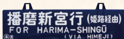
行先案内板 個人蔵