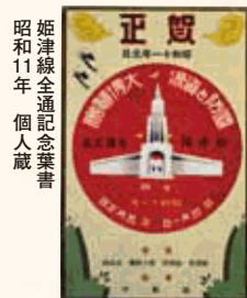
昭和11年 姫津線全通記念葉書