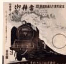
駅弁掛け紙 まねき食品株式会社蔵