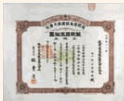
龍野電気鉄道株式会社株券 明治40年 館蔵