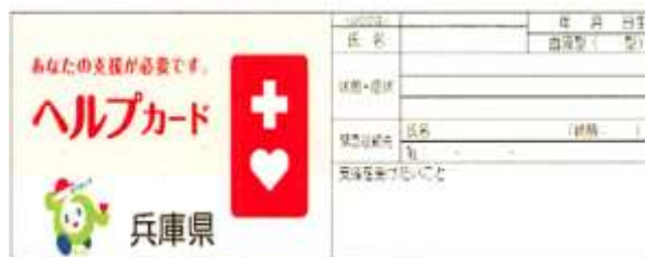
兵庫県版ヘルプカード