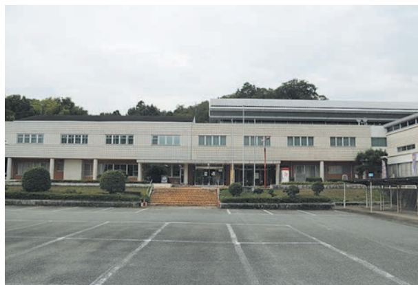
揖保川スポーツセンター