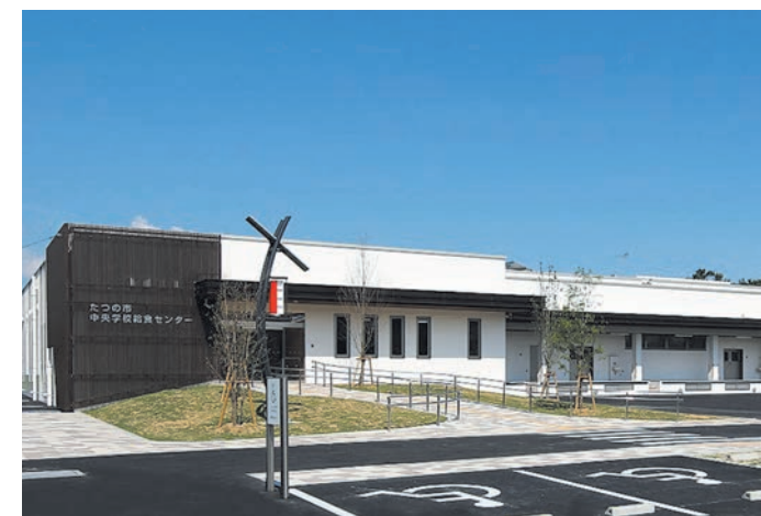
中央学校給食センター