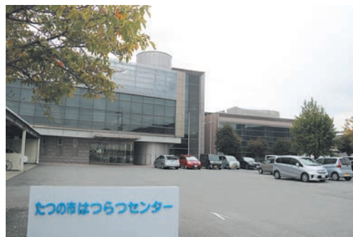
はつらつセンター

※Hib感染症及び小児の肺炎球菌感染症については、接種開始月齢により接種回数が変わります。 ※予防接種を受けに行く前に、必ず「予防接種と子どもの健康」の冊子を読みましょう。