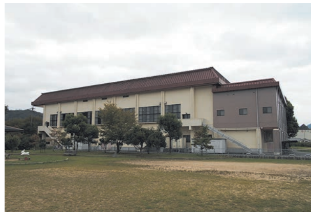
新宮スポーツセンター