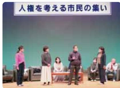
人権を考える市民の集い