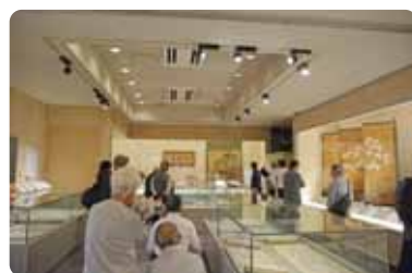
特別展「脇坂家 大名への道」