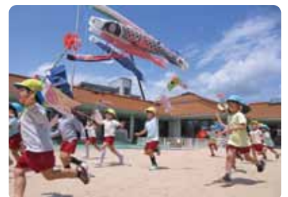
こどもの日の集い