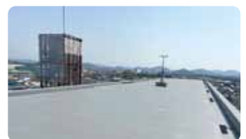
揖保川中学校校舎屋上防水工事