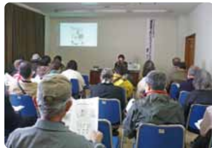
御津図書館読書講演会