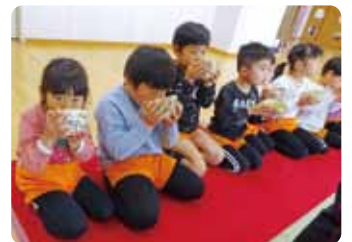
外部講師によるお茶教室