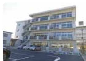
小宅小学校校舎増築