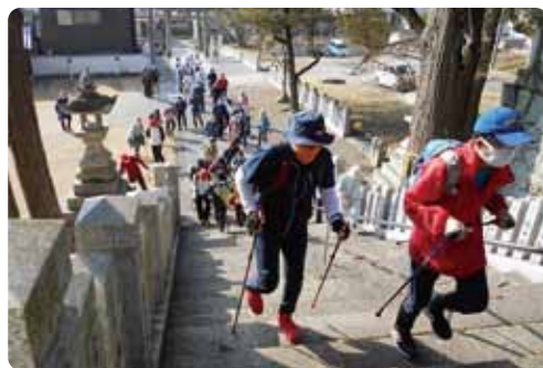
ノルディックウォーク