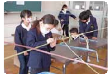
工夫した授業づくり