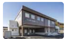
たつの市北学校給食センター