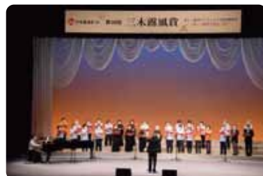
三木露風新しい童謡コンクール入賞詩発表会