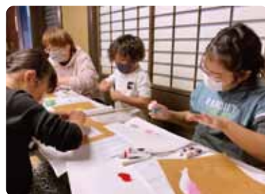
海駅館ワークショップ