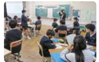
人権教育実践発表会