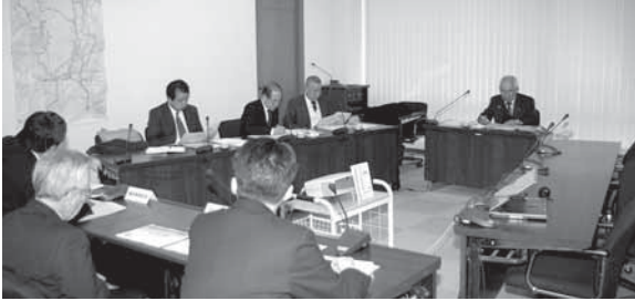
災害時要援護者支援マニュアルを調査する尾張旭市議会