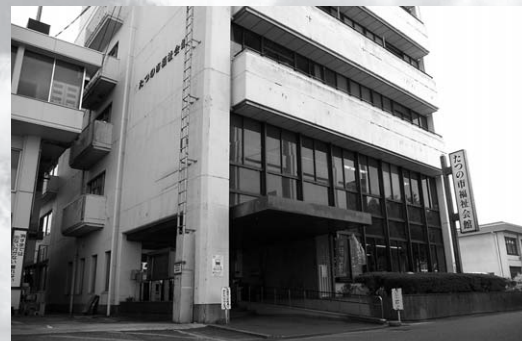
耐震補強工事を行う福祉会館（龍野町）