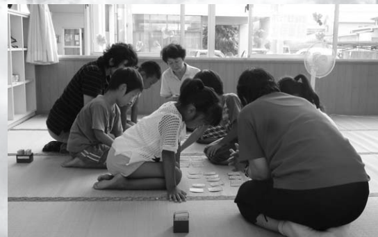
空調設備を整備する放課後児童クラブ（揖保放課後児童クラブ）