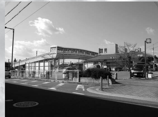
駅周辺整備に向け基本計画を作成（竜野駅前）