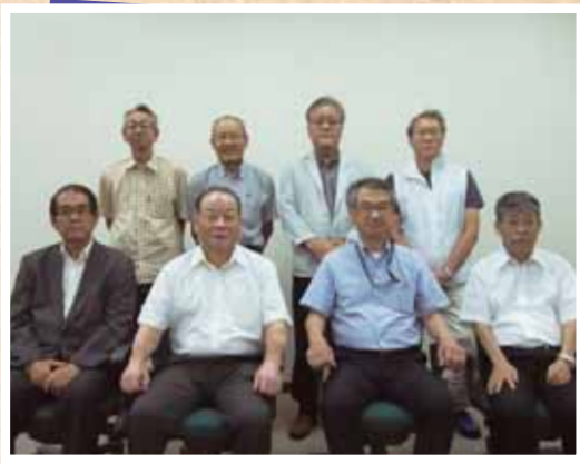
竜野駅周辺地区 まちづくり協議会の皆さん