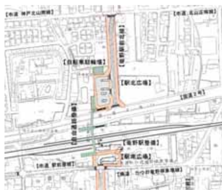
竜野駅周辺地区整備計画平面図

地域交流センターをより良いものにするともに、南北自由通路を最大限に利用し、利便性のある竜野駅にしてみたい。また、竜野駅北線と交差する北山正條線及び神戸北山南線の交通量が多く、今後さらに増加が見込まれるため、早急の周辺整備を要望する。