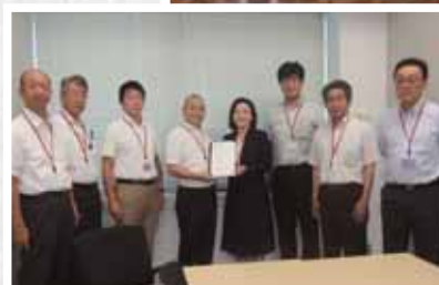
経済産業省等へ陳情