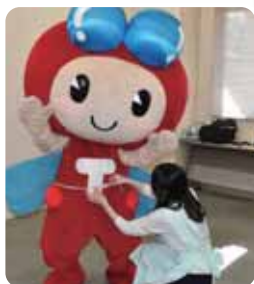
「赤とんぼくんの 胸回りは・・・?」