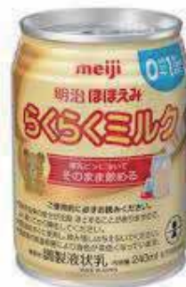
液体ミルクの備蓄を!