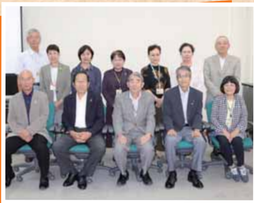
たつの市民生委員 児童委員連合会役員の皆さん