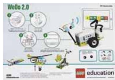
小学校のプログラミング教育で使用する支援教材『レゴ®WeDo 2.0』

問 新学習指導要領により情報教育として来年度より小学校プログラミング教育の実施、2021年に中学校でも全面的な学習を行うのか。