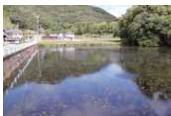
ため池の安全確保を

A ため池諸元調査業務、ため池マップ作成業務及びため池廃止設計業務の3つの事業である。昨年7月の豪雨で、広島を中心とした多くのため池決壊による被害を受け、国が補助事業として進めるものである。