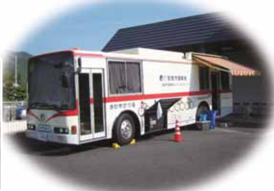
特定健診の受診を

Q 特定健康診査事業について、受診されない方の理由を把握しているのか。 A 仕事が忙しく、特に異常を感じていないというのが一番の理由である。受診率の低い地区は、重点的に国保保健師が受診勧奨している。