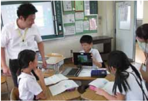
タブレットを使った授業

Q 家族介護支援事業で、自宅介護され、周りとかかわる機会のない方にはどのように情報提供してゐるのか。 A 在宅介護支援センターに委託し、介護サービス未利用者をケアマネジャーが訪問してゐる。