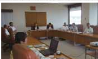
菊川市での視察の様子

議会のことを知って、関心を持っていただき、信頼されるよう、写真やイラストを多用し、徹底的に分かりやすく伝える工夫をされていました。