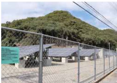
沢田前処理場の太陽光発電施設

Q 沢田前処理場の太陽光発電施設で発電された電力はどのように使用されてゐるのか。 A 売電せず、まず沢田前処理場で使い、余力があれば松原及び誉田の前処理場に送電してゐる。