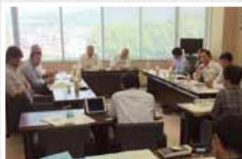
豊明市での視察の様子