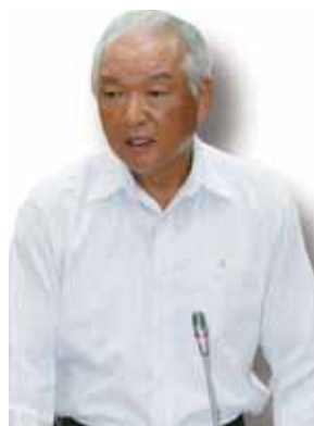
横田 勉 議員