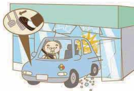
踏み間違いで重大事故に!

問 高齢運転者の安全対策について、運転免許の返納は地域的にも不便であり、運転する高齢者の方も多い。市で、踏み間違いを防止する装置の購入費用の支援を行うてはどうか。