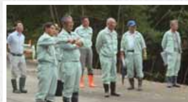
菖蒲谷森林公園を視察