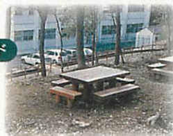
河内っ子ワールド