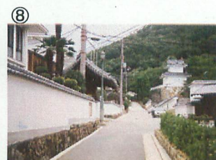
⑧ 霞城館から龍野城方向 宇野重吉の演ずる池ノ内青観が歩いた場面で使用