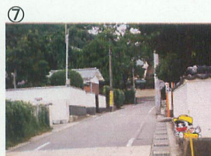
⑦ 龍野小学校南門より 動物園方向 夕焼けに染まる龍野の風景に使用