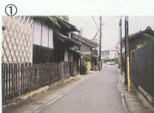
① ヒガシマル第2工場付近

寅次郎が居酒屋で変な老人と知り合う。この老人は日本画壇の大御所、池ノ内青観先生だった。相変わらず「とらや」の連中と喧嘩して旅にでて、播州龍野で青観と再会。青観のお供をして、龍野の宴会で出会ったのが大輪の花の咲いたような芸者ぼたんであった。二人はたちまち意気投合、東京に帰った寅次郎のもとにぼたんが現れる。ぼたんの上京の理由を知った寅次郎はぼたんのために人肌ぬごうとするのだが予定通りにはならず、寅次郎は再び龍野に向かうことに……。