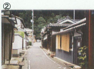
② ヒガシマル第2工場付近

寅さんが最後に樽の上に乗って「東京はどっちだ」と言って手を合わせたシーンに使われた