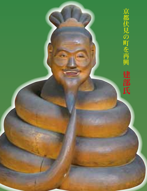
宇賀神将像 京都市・長建寺蔵