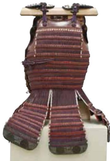
藤色威本小札胴丸具足 広寿山福聚寺蔵 北九州市指定文化財（北九州市立自然史・歴史博物館寄託） （11月8日～展示）