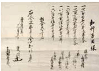
池田輝政地方知行目録 個人蔵