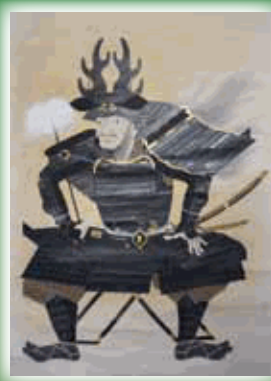
本多忠勝像 公益財団法人山崎本多藩記念館蔵