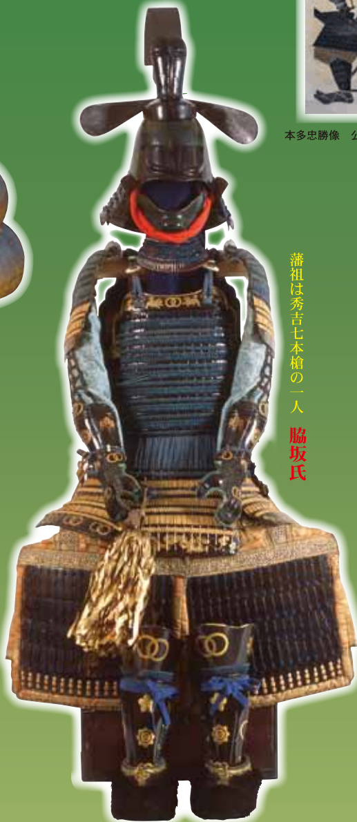
伊予札繰糸下散紅系威胴丸具足 龍野神社奉賛会蔵