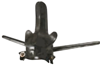
三つ葉葵紋付変り兜 公益財団法人山崎本多藩記念館蔵