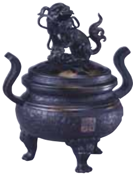
四つ目結紋入獅子香炉 丸亀市立資料館蔵