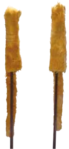
貂の皮 龍野神社奉賛会蔵