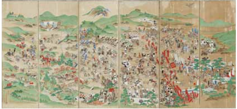
関ヶ原合戦図屏風 関ヶ原町歴史民俗資料館蔵