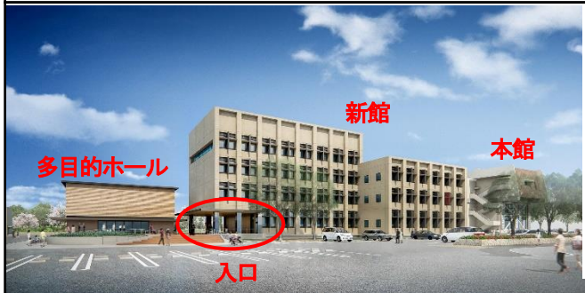
＜新館・多目的ホール 南西方向から＞

今後、本館改修工事の進捗により課の配置を変更していきますが、その都度広報等によりお知らせします。