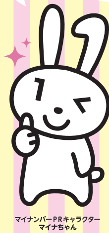
マイナンバーPRキャラクター マイナちゃん

スマホ・パソコンでラクラク! ・オンラインで確定申告ができる。 ・子育てをはじめとする行政手続きができる。 ・健診結果や医療費が確認できる(予定)。