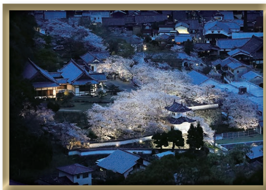
令和元年度 議長賞