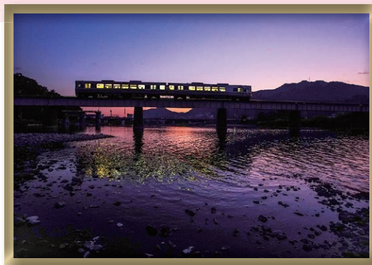
令和元年度 市長賞