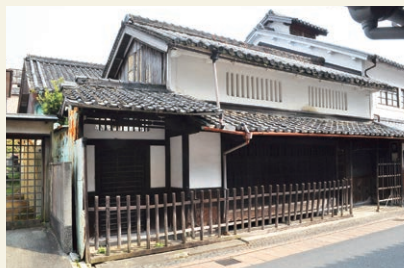
京都の形式を導入した町家