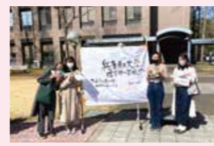
兵庫県立大学理学部キャンパスで希望する学生に食品配布