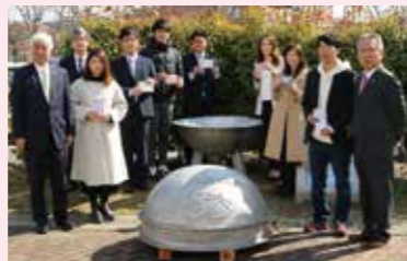
旧龍野市 市制施行50周年記念事業(平成13年実施)開封式

3月6日(土)赤とんぼ文化ホール及び新宮ふれあい福祉会館において、タイムカプセル開封式を実施しました。タイムカプセル内のメッセージを4月1日に一斉発送したところ、ご住所やお名前の変更により届かなかったものがあります。多くの方に受け取っていただきたいので、お心当たりの方は次のQRコードにアクセスの上、手続きをお願いします。