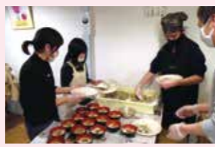
日山ごはん(龍野町富永)で開催されたこども食堂