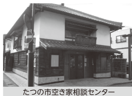
たつの市空き家相談センター