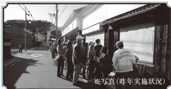
※写真(昨年実施状況)