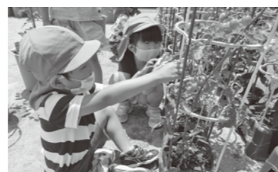
▶ 幼児教育課 (☎64・3126)