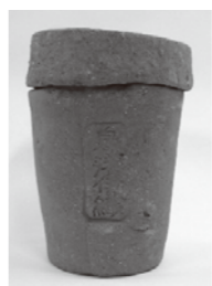
鹿沢城跡出土焼塩壺 江戸時代 六粟市教育委員会所蔵