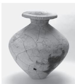
新宮宮内遺跡出土壺

市が保管している考古資料のうち、普段展示していないものの中から、学芸員イチ押しのお宝を選んで展示します。