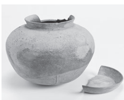
横坂丘陵遺跡出土 蔵骨器 (佐用町所蔵)