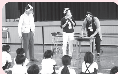
キャラバン・メイトによる寸劇場面

認知症になっても安心して暮らせるまちづくりにボランティアで協力してくださっています。