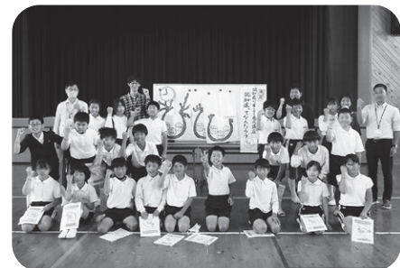
揖西東小学校5年生①