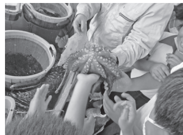
タコを触る子どもたち

皆さんも、新鮮でおいしい魚介類を手軽に手に入れることのできる室津に、足を運んでみてはいかがでしょうか。