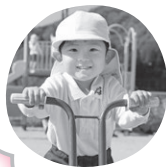
あっぷる 多機能 みつ