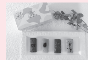
グルテンフリーベジタブルフィナンシェ

西播磨の農林水産物を使った加工食品コンテスト「西播磨フードセレクション2022」で、株式会社ささ堂農 さま工房(新宮町)の「グルテンフリーベジタブルフィナンシェ」とくりすチェスナッツ(新宮町)の「渋皮煮のプリン」が金賞を受賞しました。