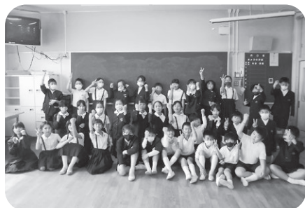
神岡小学校4年生(現5年生)