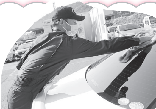
兵庫トヨタ自動車 株式会社西はりま店

A 体験を通して自分のことを知り、向いていること、やりたいことを見つけてほしい。