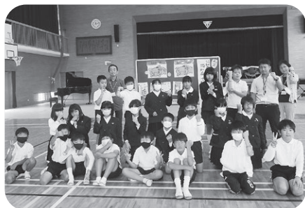
揖西西小学校4年生①