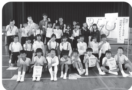
揖西東小学校5年生②