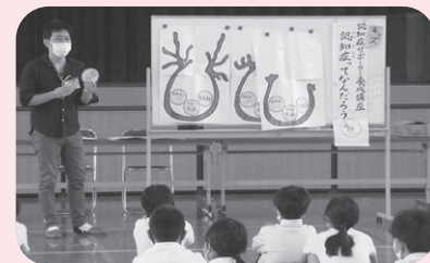
わかりやすく楽しい講座