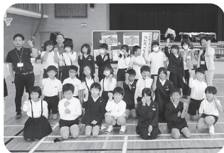
揖西西小学校4年生②