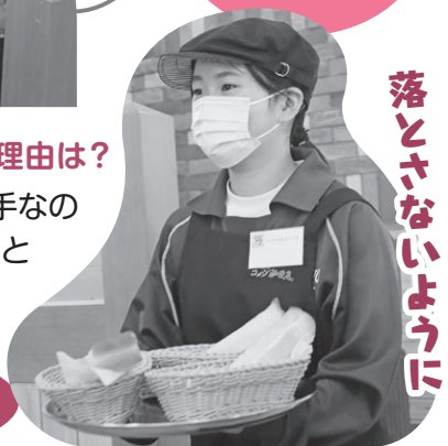
落とさないように

たつの市では、11月7日～11日の間の5日間、市内の事業所のご協力により、社会体験活動を行いました。今月号では、広報秘書課に体験に来た3人が取材したをご紹介します。