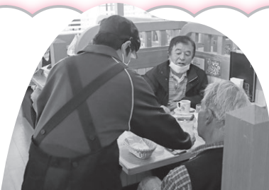
コメダ珈琲店 たつの店