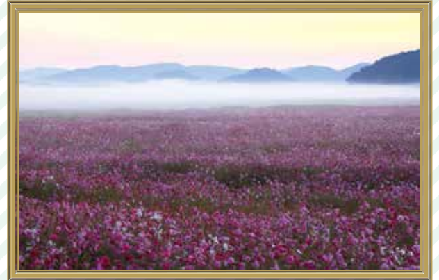
「霧のコスモス畑」赤松 博文