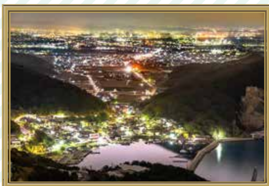
「静かなる岩見漁港」足立 孝則