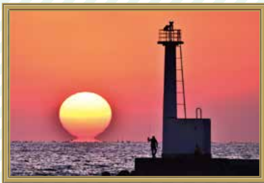
「播磨灘夕景」金岡 光春