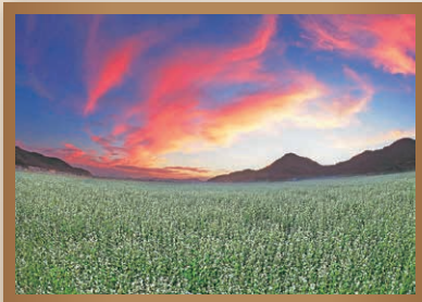
「朝焼けのそば畑」 米澤 貞雄