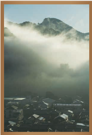
「黎明・東山」 河津 政紀