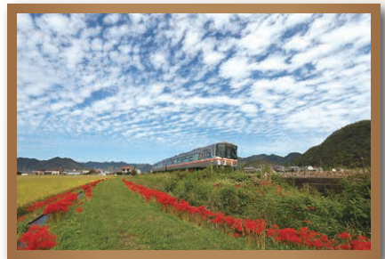
「彼岸花咲く頃」 高見 修