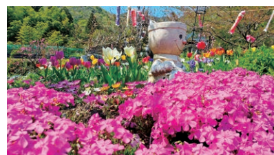
ガーデン苅尾・ガーデン苅尾2