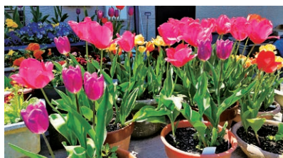
香島コミュニティセンター