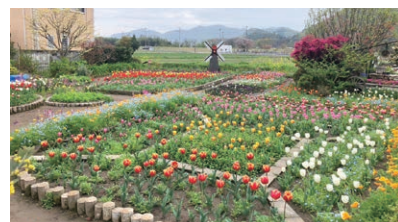
ちづちゃんの花園