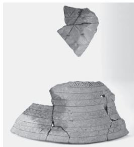
ぎょうじゅうつか 加古川市行者塚古墳出土 短甲形埴輪

■とき 6月26日(月)～7月24日(月) 9時～17時(入館は16時30分まで)