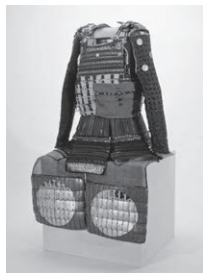
ちやいとのおどしかわつつみにまいどうくそく 茶糸威革包二枚胴具足 江戸時代 (市指定文化財)

ワークシートや関ヶ原合戦武将くじなど楽しい企画がたくさん！ お友達やご家族そろってのご来館をお待ちしています。