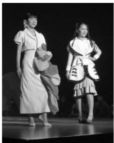
昨年度のコンテスト グランプリ作品(左)

選ばれたデザイナー画は、衣装制作し、11月18日(土)・19日(日)開催の「皮革まつり」のファッションショーで披露します。