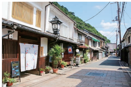
龍野伝統的建造物群保存地区

龍野地区では、重要伝統的建造物群保存地区選定5周年を記念した各種事業を実施することにより、地域住民の気運を高め、更なる魅力を発信します。