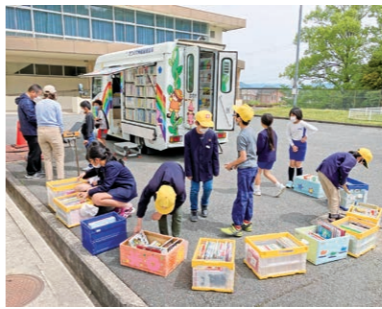
市内全域を巡回する移動図書館「かわちどり号」

「移動図書館事業」「電子図書館事業」及び「障害者読書環境整備事業」など様々な生活状況において、市民に読書の機会を提供する幅広いサービスを展開するとともに、播磨圏域連携中核都市圏及び播磨科学公園都市圏特定住自立圏の図書館と連携し、広域利用サービスを促進します。