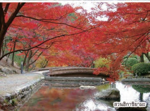
สวนฮิกายามะ

ทิวทัศน์สวยงามที่เปลี่ยนแปลงไปตามฤดูกาลตั้งแต่ดอกซากุระสีชมพูที่บ้านสะพรั่งทำให้ผู้คนหลงใหล ป่าไม้เขียวชอุ่ม ใบไม้สีแดงในฤดูใบไม้ร่วง แสงระยิบระยับจากแสงอาทิตย์ในช่วงเช้าและเย็นที่สะท้อนบนผิวน้ำชายทะเล จนถึงเมืองและท่าเรือที่มีกลิ่นอายของประวัติศาสตร์ ขอเชิญมาสัมผัส "เมืองทัทซึโนะ" ด้วยตัวของท่านเอง