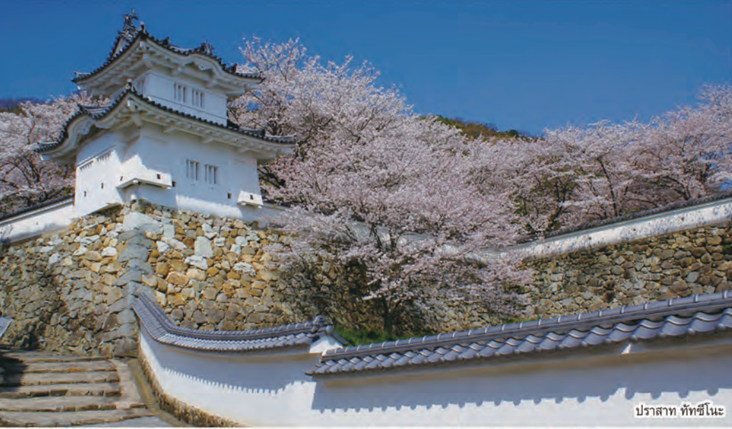
ปราสาท ทัทซึโนะ

อึ้งใจกับการท่องเที่ยว เก็บเกี่ยวสู่เพิ่มภาพ