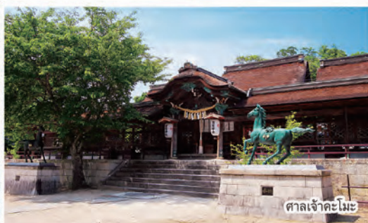
ศาลเจ้าคะโมะ