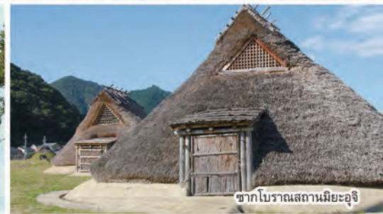
ซากโบราณสถานมียะอุจิ