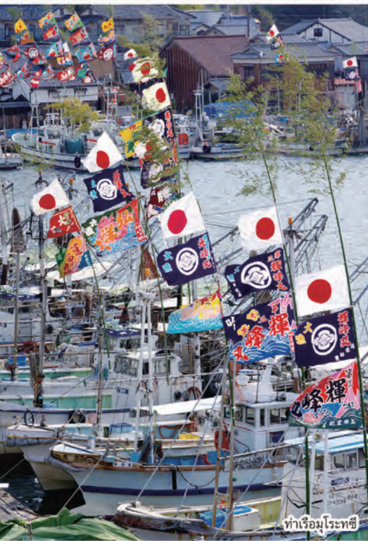
ท่าเรือมูโรทซึ