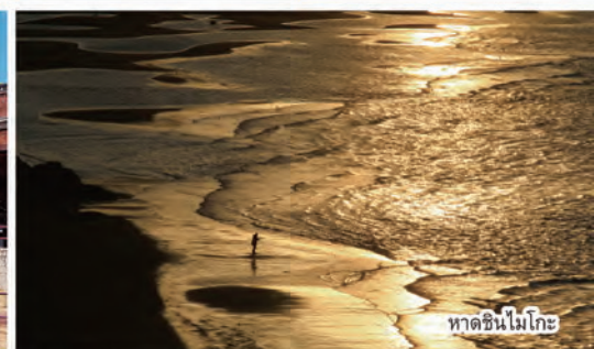
หาดชินโมโตะ