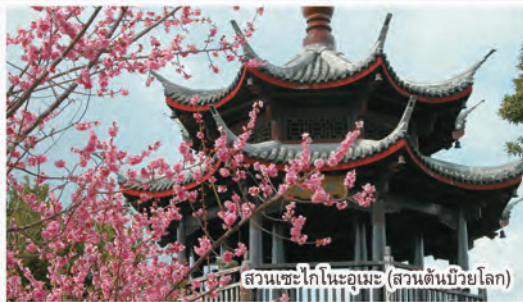
สวนเซะโกโนะอูเมะ (สวนต้นบ๊วยโลก)