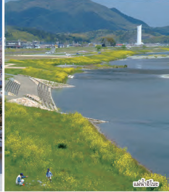
แม่น้ำอิโนะ