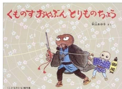
『くものすおやぶんとりものちょう』 秋山 あゆ子 著 福音館書店

ところが、近頃はせつかく借りた本も読まぬまま、子どもに絵本を読んで一緒に寝てしまいます。もったいない事になってはいますが、絵本もおもしろく、寝る前に朗々と読んでやるのが今の私の楽しみです。さあ、また週末も図書館だ！