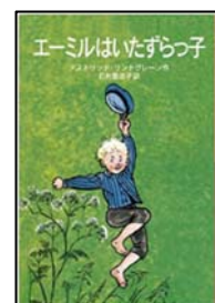
『エーミルはいたずらっ子』

いつか孫ができれば、娘に『絵本論』を薦めて、みんなで一緒に図書館へ通いたいです。