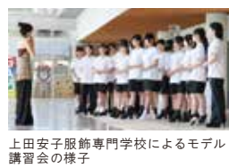
上田安子服飾専門学校によるモデル講習会の様子