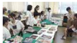
アルファジャパン美容専門学校によるヘアメイク講習会の様子