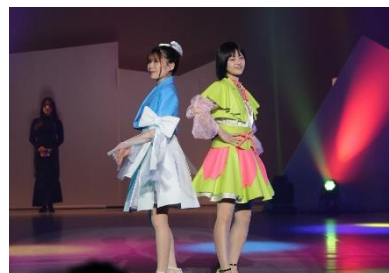
令和6年度たつの観光大使

開催日：11月15日(土) 10時～16時 (開会式 9時～10時) 11月16日(日) 9時～16時 会場：たつの市総合文化会館赤とんぼ文化ホール たつの市青少年館及び屋外特設会場